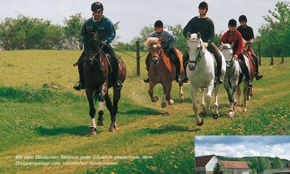
Mit dem Deutschen Reitpass jeder Situation gewachsen: dem Gruppengalopp oder natürlichen Hindernissen.

Wie bereite ich ein Pferd für den Ausritt vor? Wie reitet man in der Gruppe? Wie überholt man andere Reiter? Geübt wird das Reiten in allen Gangarten. Präzision ist beim Galopp von Punkt zu Punkt gefragt. Schließlich ist ein kurzer Bremsweg im Gelände lebenswichtig. Lässt sich mein Pferd problemlos von der Gruppe wegreiten? Vielleicht muss ich einmal Hilfe holen und dann ist es schon gut, wenn mein Pferd sich von den anderen trennen kann. Das richtige Verhalten im Straßenverkehr wird geübt.